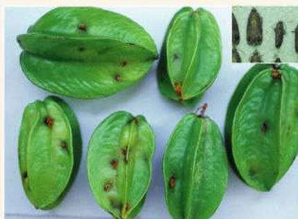
▲受害楊桃果皮上有蛀蟲所排出之糞便

花姬捲葉蛾( Eucosma notanthes )俗稱楊桃果實蛀蟲，為楊桃生育期間最重要之害蟲，楊桃自謝花結小果至成熟期間，均會遭受花姬捲葉蛾產卵蛀食危害，嚴重影響楊桃的品質與產量。另梨、荔枝、龍眼、桃、釋迦等果實亦遭受其蛀食危害，須注意防範。