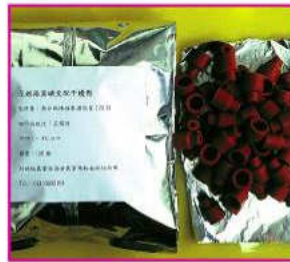
▲花姬捲葉蛾性費洛蒙交配干擾劑成品，有效期5個月