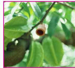
▲花姬捲葉蛾性費洛蒙交配干擾劑(以棋盤式每3~4公尺掛一個干擾劑)