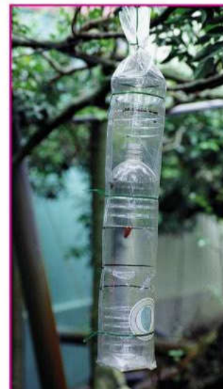
▲花姬捲葉蛾性費洛蒙誘蟲器(誘餌設置於誘蟲入口處上方5公分處、田間設置高度為150公分；大量誘殺每15公尺設置一個，並加強周邊之設置)