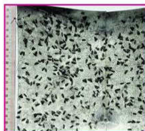
▲花姬捲葉蛾性費洛蒙誘餌具強烈誘引效果

花姬捲葉蛾的交配干擾劑是由較高劑量的性費洛蒙配製而成。每公頃平均設置1,200個干擾劑(約50g性費洛蒙)，使果園中充滿性費洛蒙的氣味，以達到混淆雌、雄蛾間之溝通，使其無法交配及繁殖後代。使用時，需先清園以降低花姬捲葉蛾及其它害蟲密度，再約每隔3-4公尺掛一個干擾劑，干擾劑設置高度約為150公分。每分地以棋盤式懸掛120個干擾劑，在果園周邊增設干擾劑可提高效果。使用交配干擾劑防治期間須定期調查果實受害情形，並掛監測用誘蟲器觀察，如果誘蟲器捉不到蟲隻，即表示干擾劑發揮效用。另干擾劑施用期間，果園周邊宜定期施藥，防止受孕雌蟲侵入產卵。試驗結果顯示，交配干擾劑之有效性長達五個月，防治效果與一般施藥防治者相當。