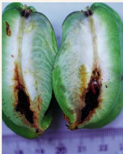
▲楊桃果肉受蛀蟲危害狀