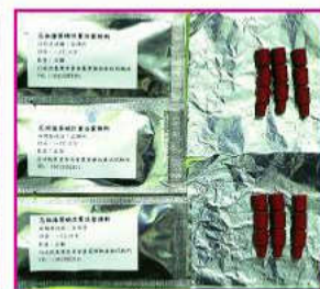
▲花姬捲葉蛾性費洛蒙誘餌成品，有效期6個月